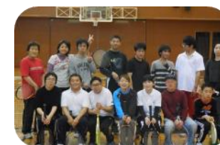
テニス 障がい者交流プラザ体育館 他