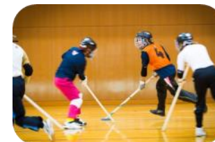
フロアホッケー 障がい者交流プラザ体育館