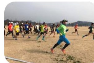
陸上 徳島市陸上競技場 他