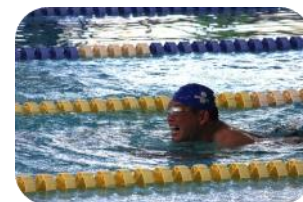
競泳 障がい者交流プラザプール 他