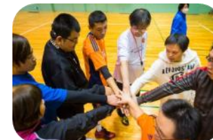
バスケットボール 徳島市立体育館