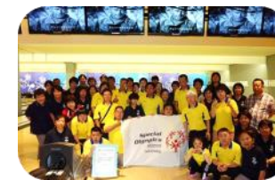
ボウリング スエヒロボウル、石井ポップジョイ