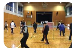
バドミントン 障がい者交流プラザ体育館 他