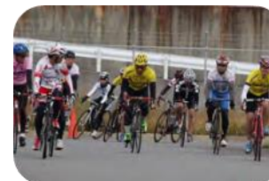
自転車 小松島競輪場 他

SON・徳島のスポーツプログラムを紹介します。アスリートを中心に、コーチ・ファミリー・ボランティアがともにチャレンジし、楽しみながら、月2~3回2時間程度のプログラムを年間を通して実施しています。