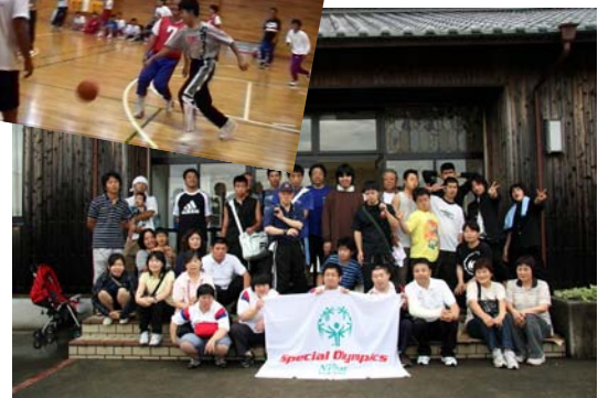
特定非営利活動法人 スペシャルオリンピックス日本・徳島