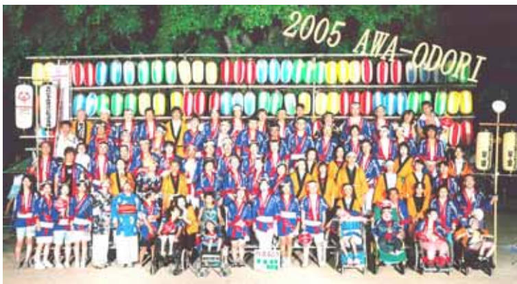
今年、アスリート委員会が、全国のSOメンバーに呼びかけ、宮城、富山、石川、愛知、大阪、福岡の6府県のSOメンバーも参加した。今年新調したお揃いの法被を着て、総勢170名が、13日市役所前演舞場、発光ダイオード(LED)が光を放つ幻想的な幸町踊りロードに踊りこんだ。 アスリートが一生懸命踊る勇姿に、観客からは大きな拍手が沸き起こった。