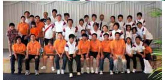
2005/9/25 高知とのボウリング交流会