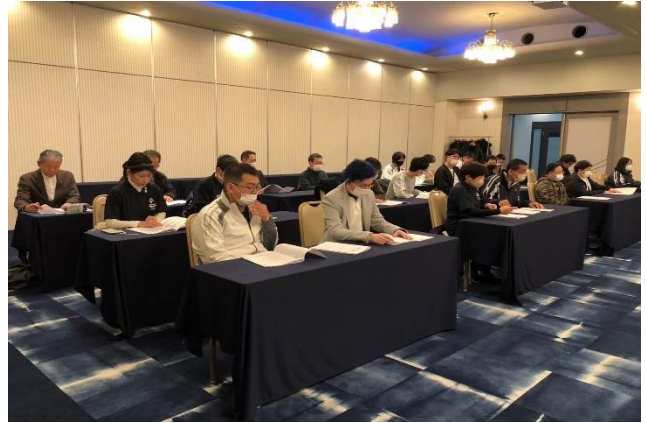
1/28 理事会・社員総会