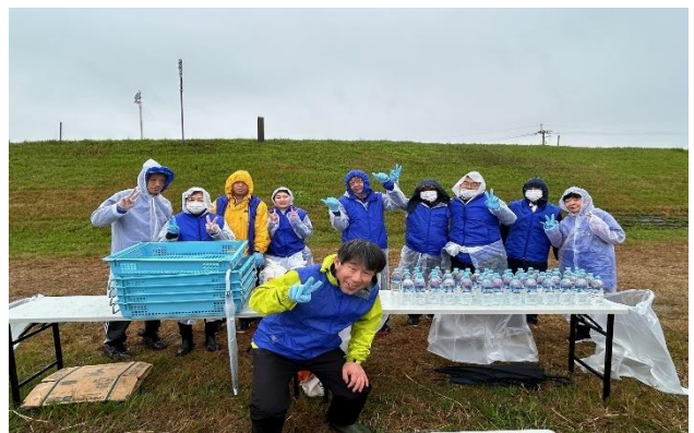
3/24 とくしまマラソン給水ボランティア