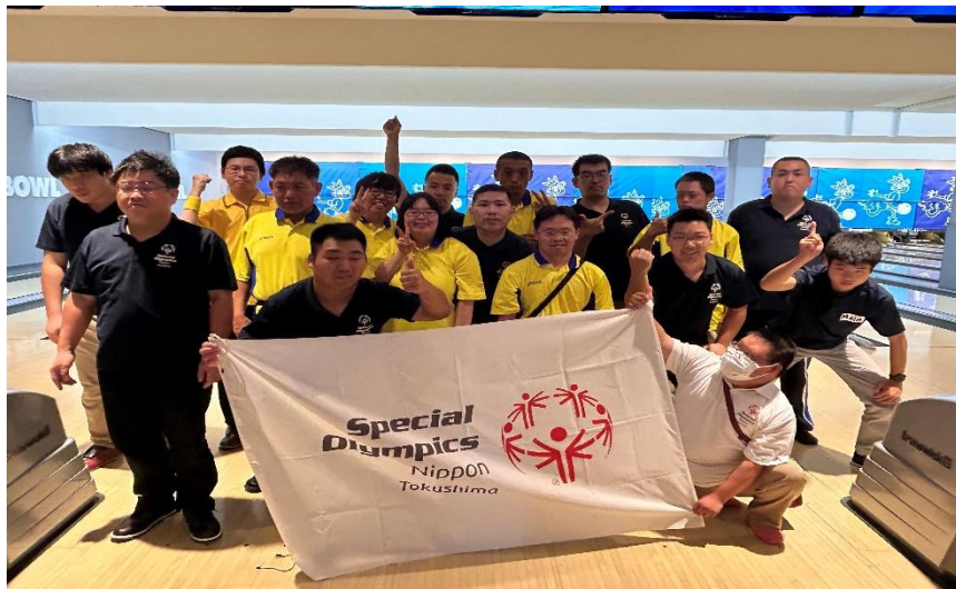
9/21 徳島地区 ボウリング競技会