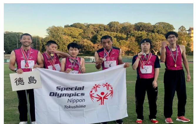
11/3 陸上競技会 (SON・兵庫にて)