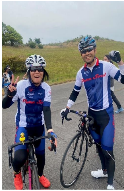
5/19 自転車競技会 (SON・広島にて)