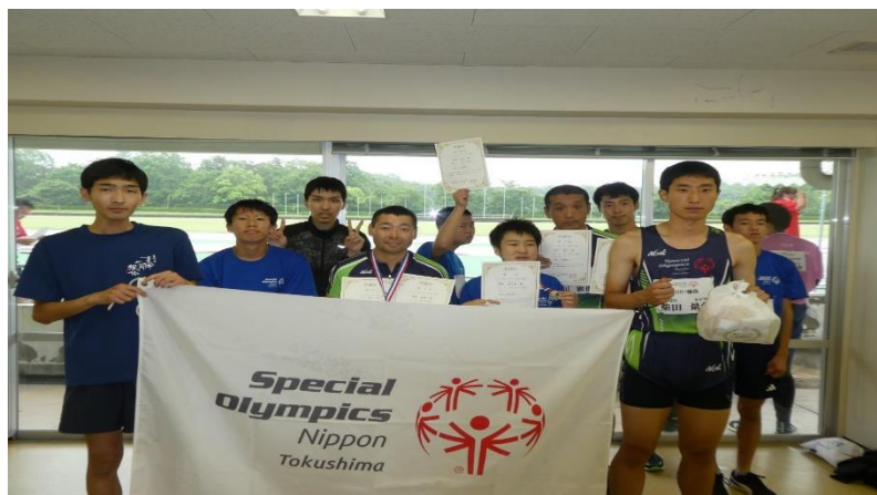
7/14 陸上競技会 (SON・広島にて)