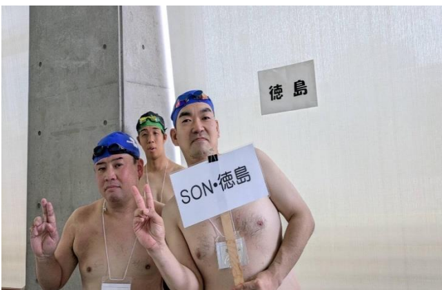
8/25 競泳競技会 (SON・岡山にて)