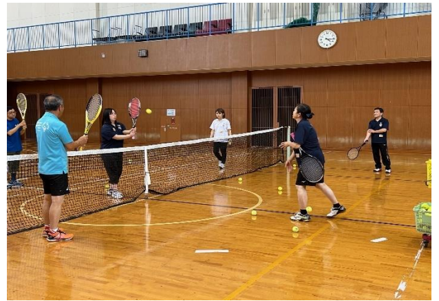
7/13 テニス・コーチクリニック