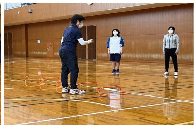
4/3 陸上プログラム コーチクリニック 開催