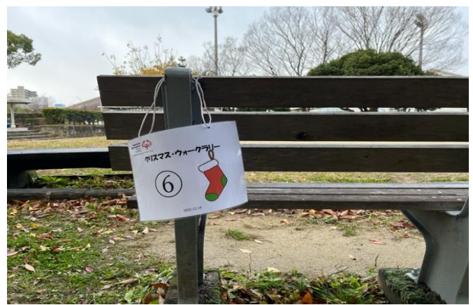
12/18 クリスマスウォークラリー 開催 徳島城公園にて