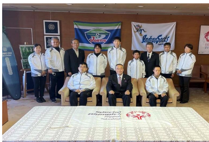
10/26 夏季ナショナルゲーム・広島大会 選手団 県知事表敬訪問