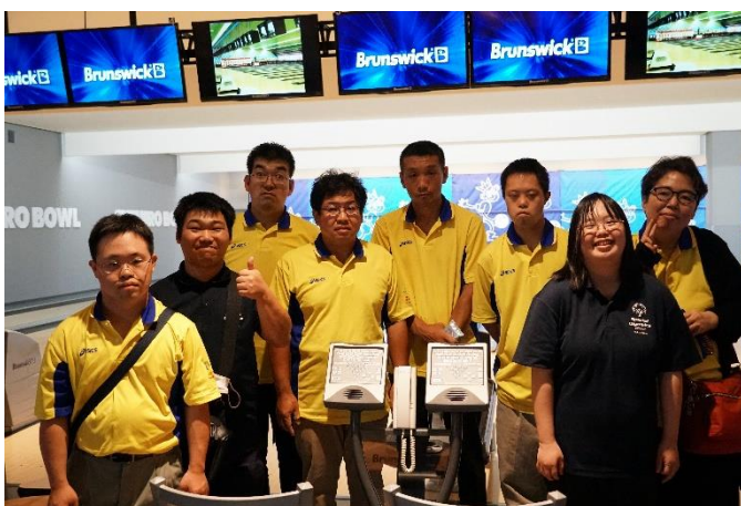
7/16 オンラインボウリング記録会 出場