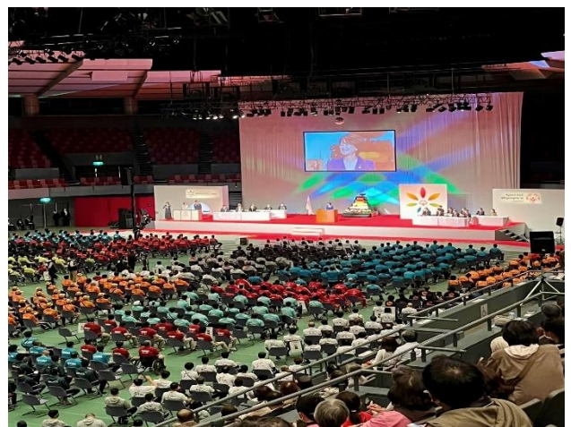
11/4～6 夏季ナショナルゲーム・広島大会 出場 (競泳・ボウリング・自転車・陸上 合計 7 名のアスリート)