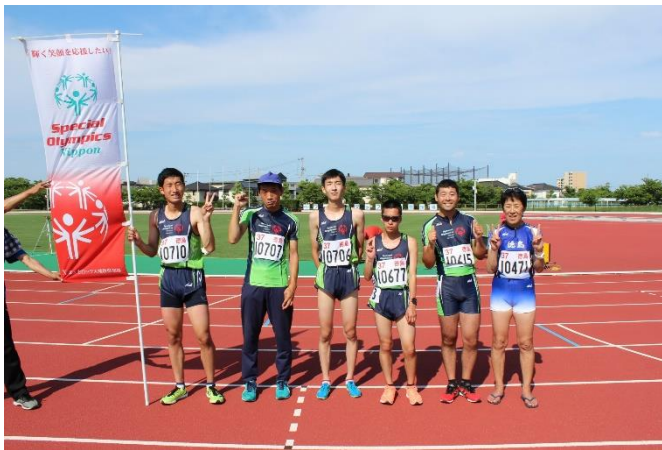
6/26 徳島マスターズ陸上競技選手権大会 出場