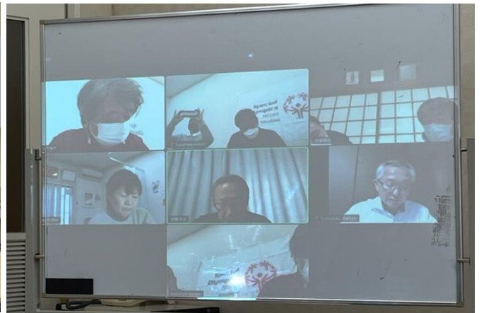
1/30 理事会・社員総会 開催