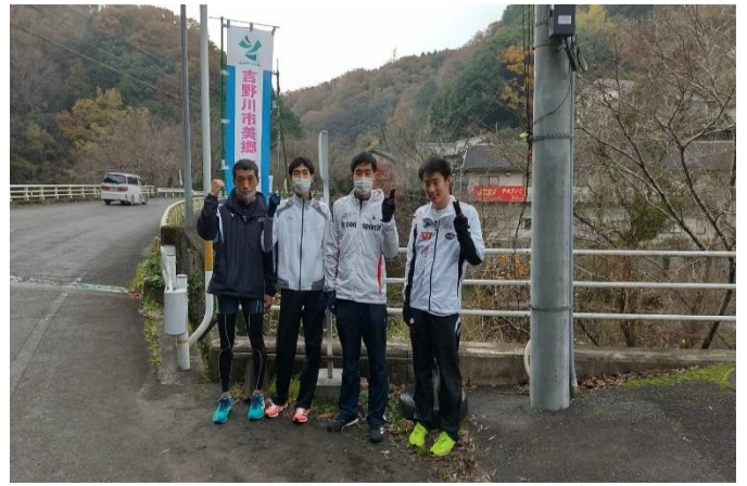
12/4 美郷駅伝 参加