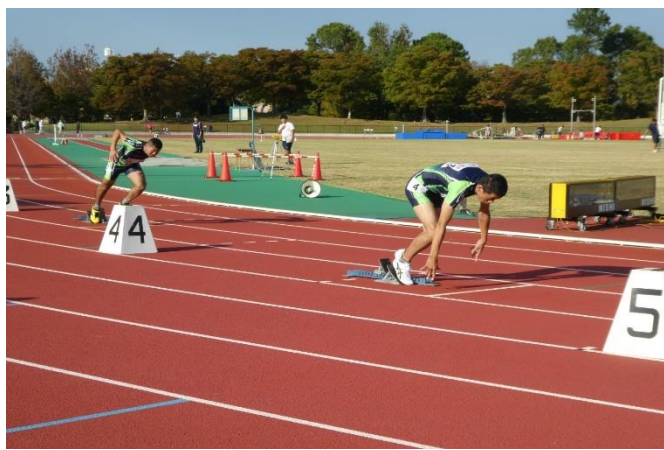
10/23 徳島マスターズ秋季陸上競技記録大会 出場