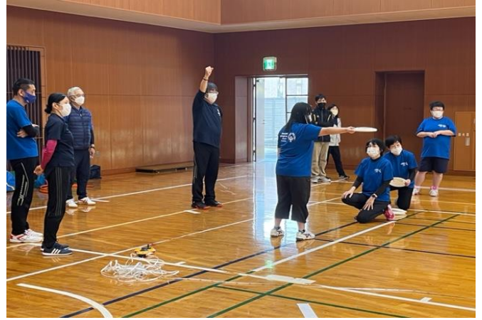
11/19 フライングディスク・コーチクリニック 開催