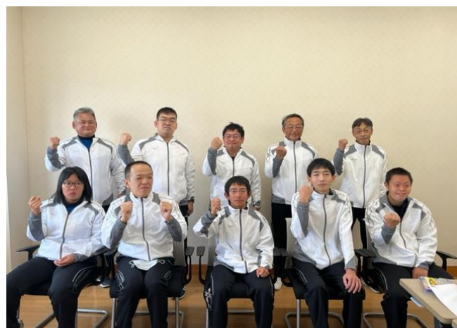
10/30 夏季ナショナルゲーム・広島 選手団 結団式