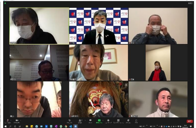
3/1 臨時理事会 開催