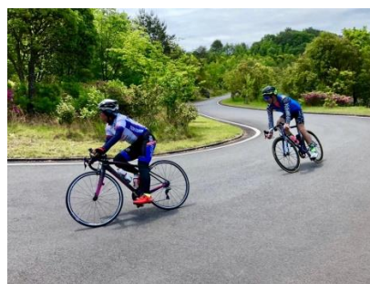
5/19 (日) SON・広島第9回自転車競技会