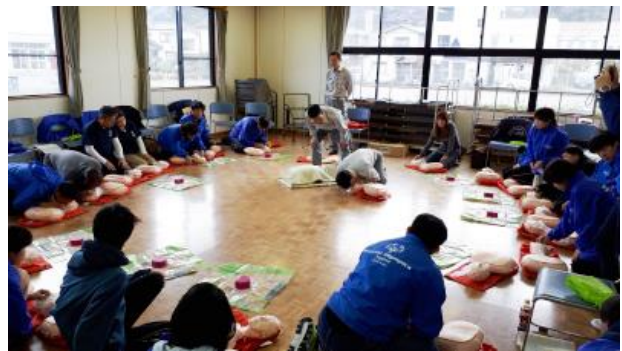
3/24 (日) AED、応急手当の知識を学ぶ救命講習会を開催