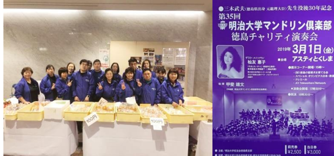
3/1 (金) 明治大学マンドリン倶楽部徳島チャリティ演奏会 PR ブース