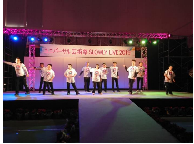
12/14 (土) ユニバーサル芸術祭にダンス出演