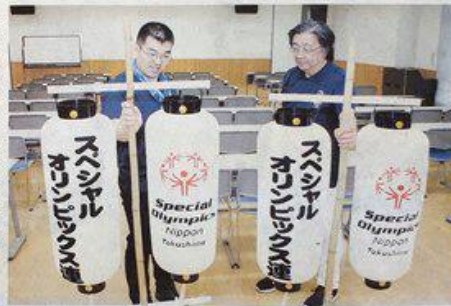
新しい高張りちようちんを手に笑顔を見せる高張りちようちん—徳島市の阿波踊りに参加する高張りちようちん

認定NPO法人スベシャルオリンピックス(SO)日本・徳島は、クラウン目録、12日に約130名が市役所前演舞場で、5月21日から45日間、阿波踊りの高張りちようちんを新調した。演舞場を披露する。寄附を募り、目標額40万円(40万円)を上回る68万円(68万円)を達成し、高張りちようちんを新調した。高張りちようちんは、支援への感謝を込めて、8月、92人が製作した。高張りちようちんは、高張りちようちん(高さ約90cm、直径約30cm)2山城西2は「たくさ組4個を作り、踊り連の人の支えでちょうちんの名称やSOのロゴマークがよみがえった。1つを記した。踊り参一生懸命踊るので、参加者に渡すレハッシュの人の見えてほしい」と話した。