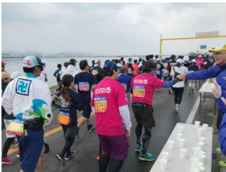
3/17 (日) 2019 とくしまマラソン 第一給水所ボランティア