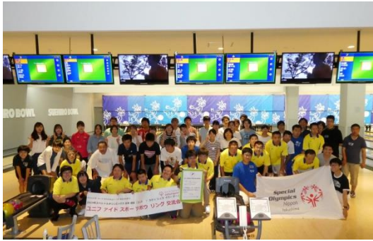
6/30(日)ユニス・ケネディ・シユライバー・デー「ユニファイドスポーツ・ボウリング交流会」開催【赤い羽根共同募金テーマ型募金助成事業】