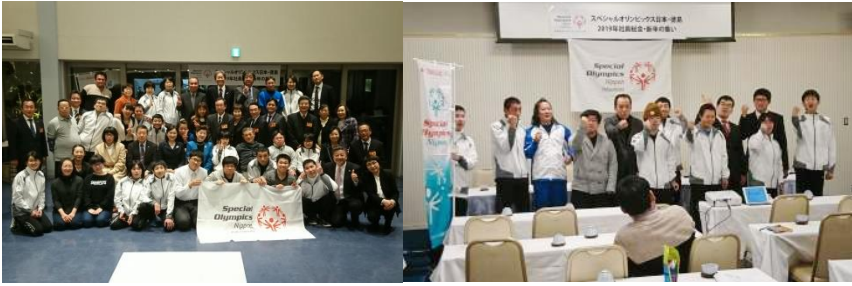
1/27 (日) 2019 年度総会・コーチクリニック・新年の集い 開催