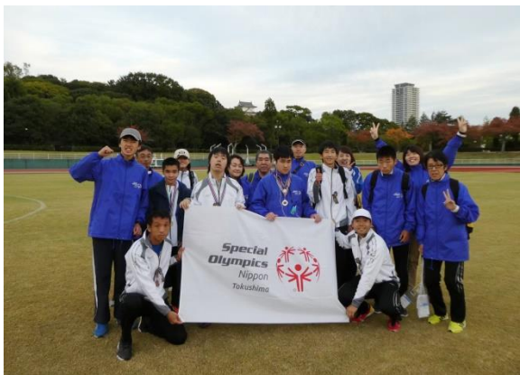
11/10 (日) SON・兵庫陸上競技会