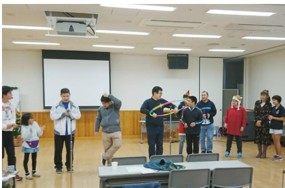
12/1 (日) SON・徳島クリスマス会