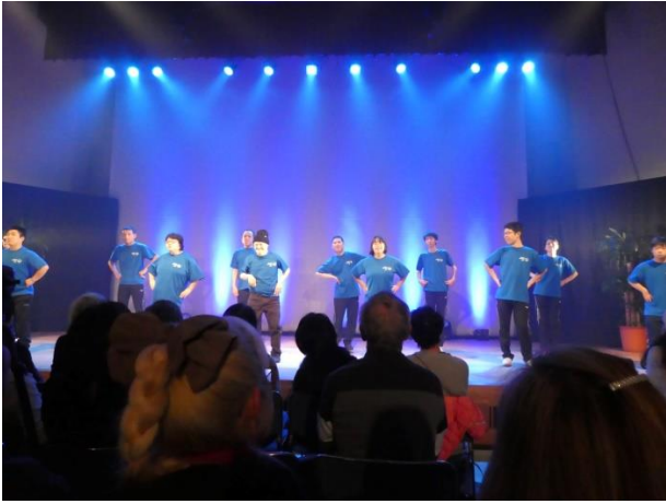
12/7 (土) SON・ダンスクラブ、「ザ・ラップ」ダンス発表会にゲスト出演