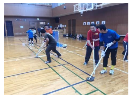
5/25 (土) フロアホッケーコーチクリニック