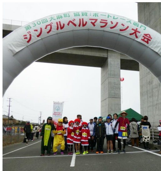
12/22 (日) 第 30 回ジングルベルマラソン大会