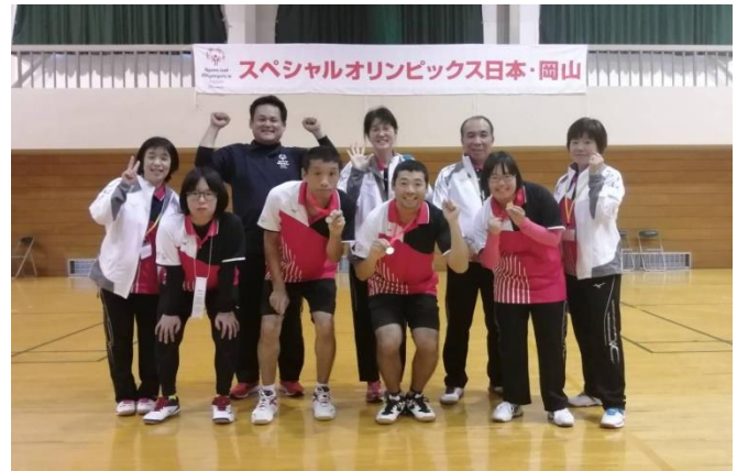
11/2 (土) SON・岡山バドミントン競技会