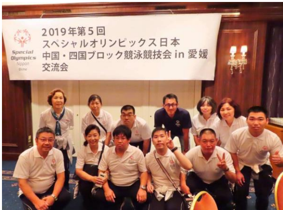
10/27 (日) スペシャルオリンピックス日本中国・四国ブロック競泳競技会 in 愛媛