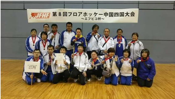
2/16 (土) ユニバーサルフロアホッケー中国四国大会～エフビコ杯～