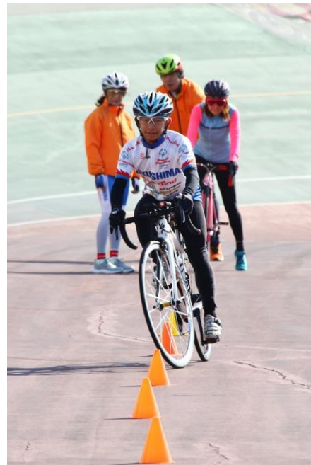
12/1 (日) 自転車コーチクリニック