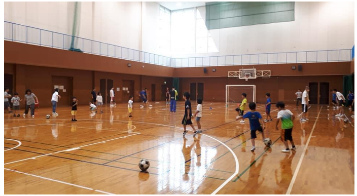
9/28 (土) サッカーコーチクリニック