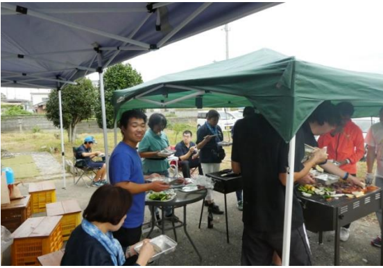
9/21 (土) BBQ in 民宿「旅の途中」