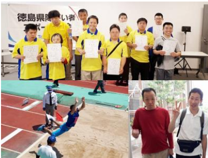
5/11、5/18 (土) ノーマピック・スポーツ大会 (ボウリング、陸上、水泳)