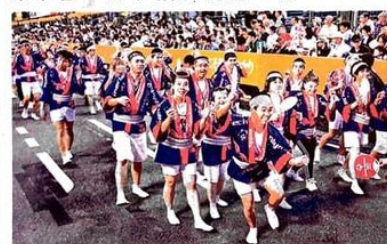
徳島市の阿波踊りへ参加を控え、高張りちようちんを新調する資金を募っているSO日本・徳島の踊り子—昨年8月、市役所前演舞場

知的障害者スポーツや文化を楽しむ機会を提供する認定NPO法人スベシャルオリンピックス(SO)日本・徳島(徳島市)が、同市の阿波踊りに参加して今年で20年目を迎える。長年使ってきた高張りちようちんが破れて使用できなくなっており、新調する資金を21日からクラウドファンディング(CF)で募っている。資金面での応援に加え、SOの活動にも関心を持ってもらおう。