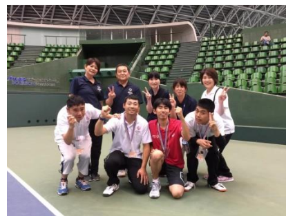
6/16 (日) SON・兵庫第13回テニス競技会