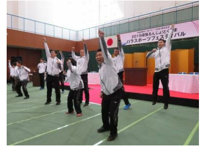
1/27 (日) 「2019 とくしまパラスポーツフェスティバル」オープニングダンス出演