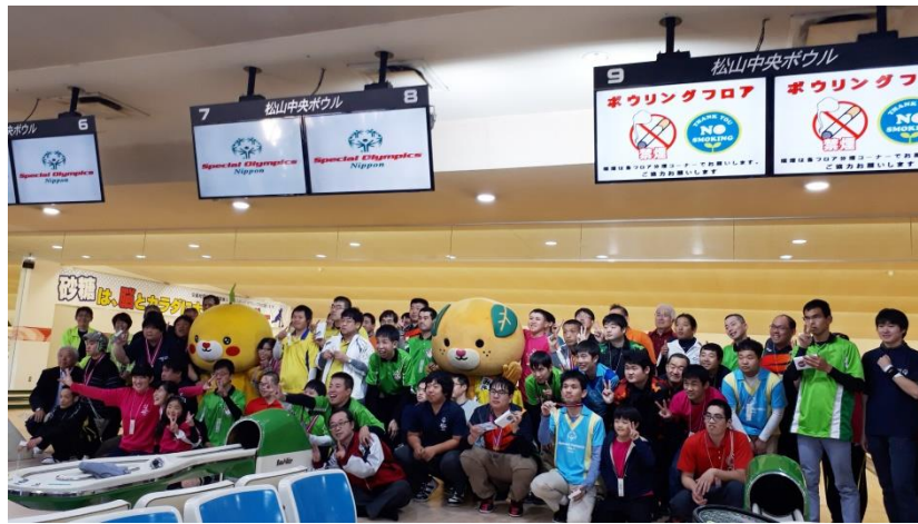
12/15 (日) 第 12 回 SON・愛媛松山湯築ライオンズクラブボウリング競技会