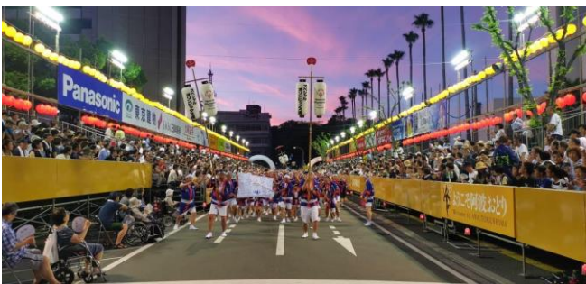
8/12(月)アスリート・ボランティア等と徳島市阿波おどりへ参加