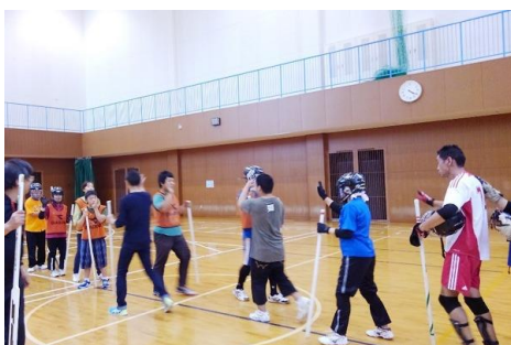
6/8 (土) 活動説明会&フロアホッケー体験会